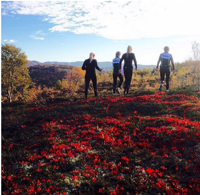
Fagre høstfarger i ryggen gir motivasjon for fremtiden

Facebook-oppdateringer har fungert bedre i 2016 enn tidligere år, med bidrag fra flere personer.